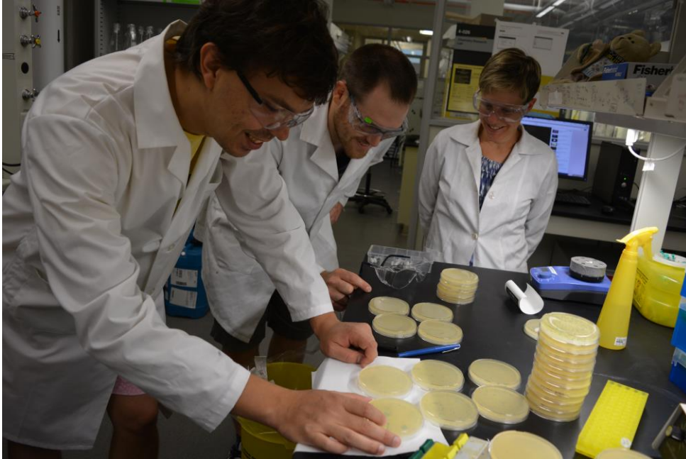
Labo Derda, U Alberta, juillet 2016